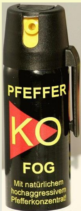
Pfefferspray € 4,-

ABFERTIGUNG für Beamte kommt ..... Seite 1